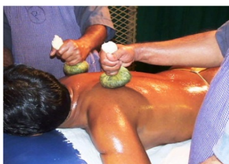
ピンダ・スウェダ