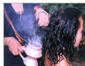
ハーバルヘアケア