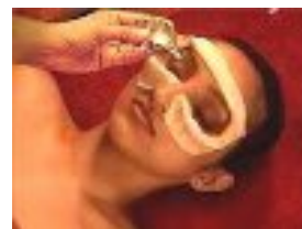
ネトゥラバステイ