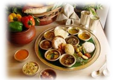
アーユルヴェーダ料理でデトックス