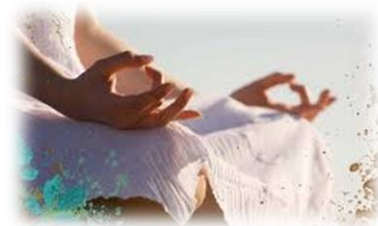
インドで YOGA 三昧