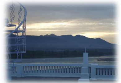
アーユルヴェーダ保養所からの風景